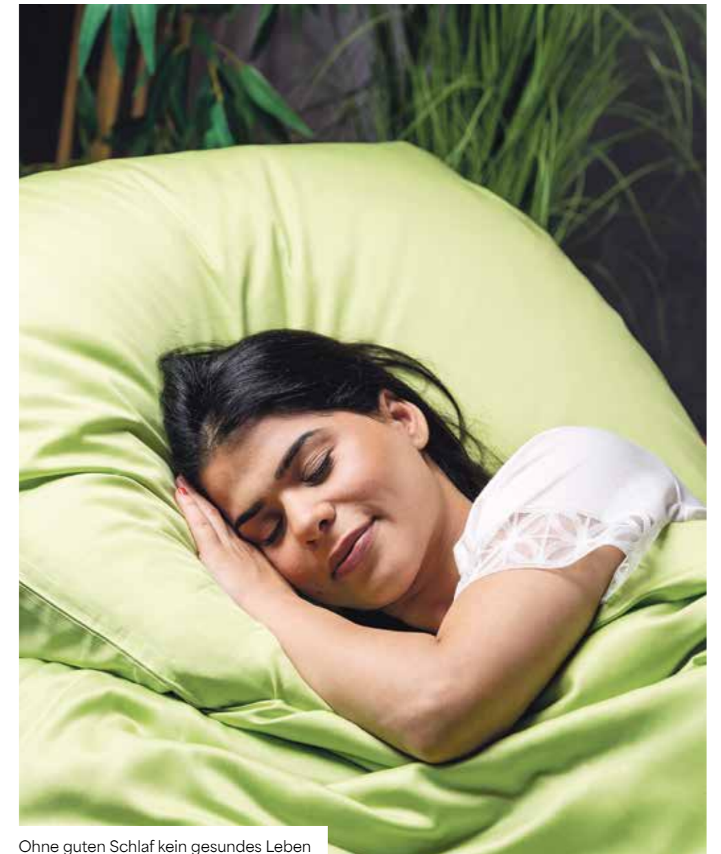
Ohne guten Schlaf kein gesundes Leben

„So, wie der Schlaf individuell ist, muss es das Bett auch sein.“