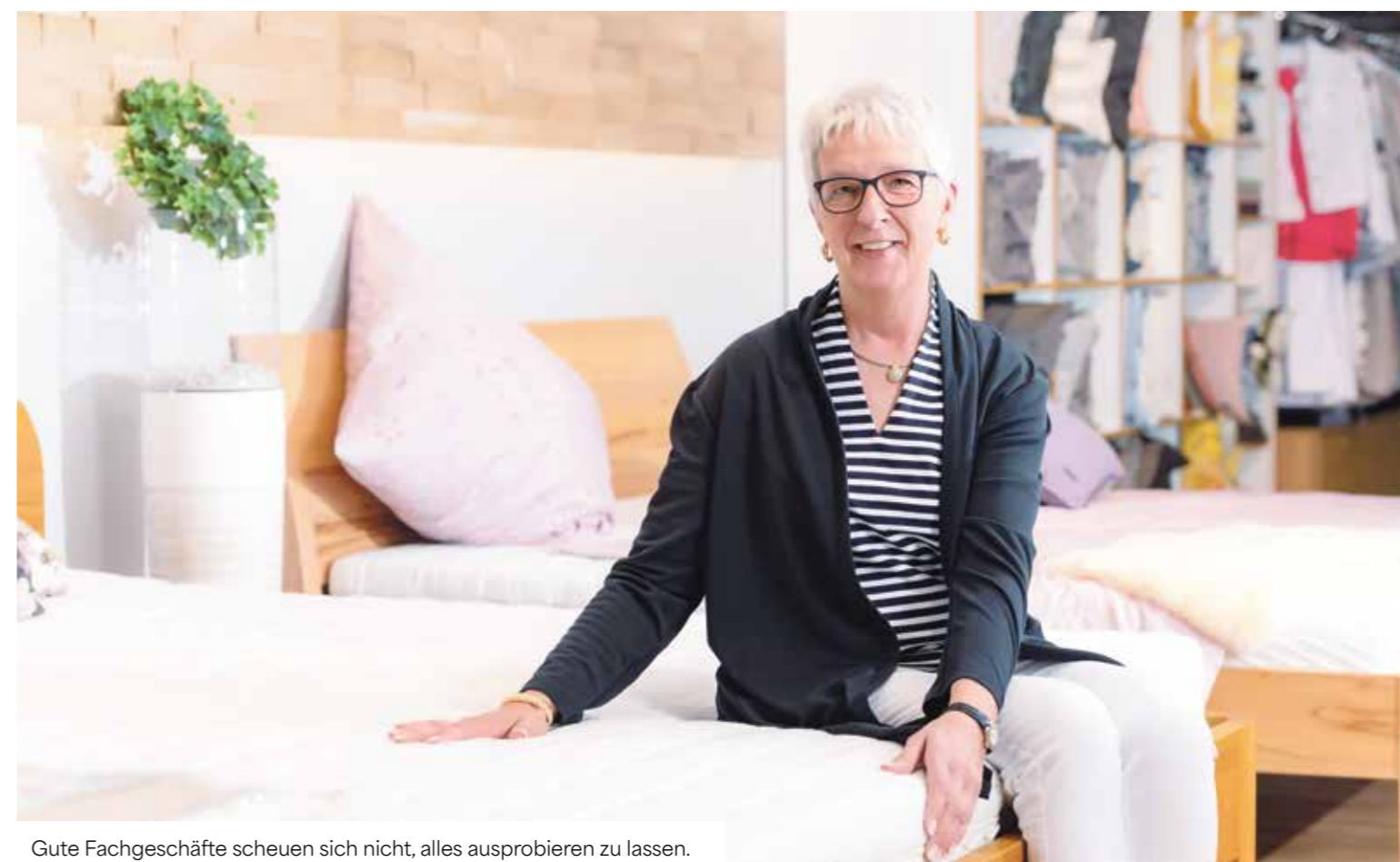
Gute Fachgeschäfte scheuen sich nicht, alles ausprobieren zu lassen.