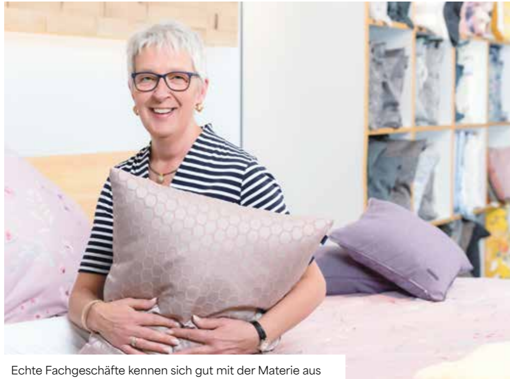
Echte Fachgeschäfte kennen sich gut mit der Materie aus

Das System Mensch arbeitet, wie bei den meisten Lebewesen, im Schichtbetrieb. Am Tag nehmen wir Nahrung und Informationen auf, die nur im Schlaf, während der Nacht, verarbeitet werden können. Aus diesen drei Quellen, Bewegung, Essen und Schlafen, schöpfen wir demnach unser Leben, und steuern im Wesentlichen unsere Gesundheit. Na-